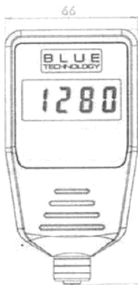
P-13-FE / P-13-AL

Pe baza măsurătorilor putem afirma că suprafața a fost reparată (vopsită, umplută). Instrumentul măsoară în unități micrometrice (µm).